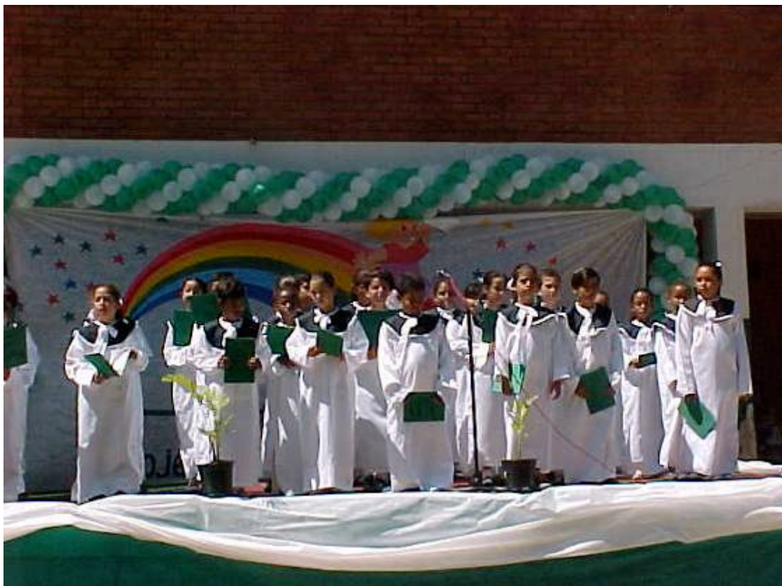
Coral infantil – Projeto Sementeira